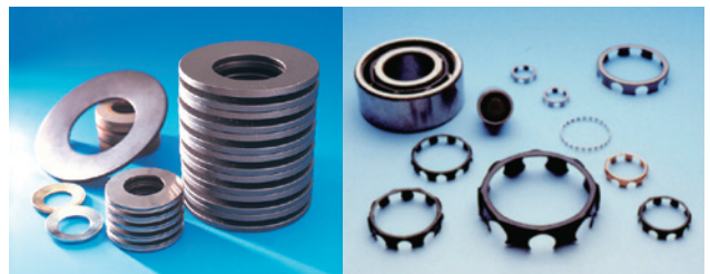
広がり続ける平和発條の製品群

市三は1982(昭和57)年に社長の座を辞し、その後は会長・相談役として計50年近く平和発條の成長発展に腐心し続けた。時代の荒波に揉まれながらも「誠実」を胸に努力を積み上げてきた男と、その思いによって成長してきた平和発條は、これからの高い技術力と品質で信頼を積み重ねていく。