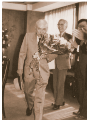
社長を退いてからの市三

現在、平和発條では、皿ばね(写真左)、座金、薄板ばね、止め輪等の製品を自動車、産業機械、建設機械、鉄道、住宅などの幅広い分野に提供している。また、ベアリング部品(冠型保持器、写真右)では国内No.1のシェアを誇る。