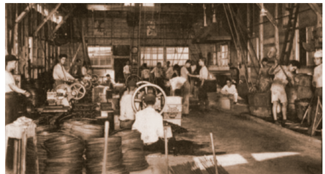
当時のばね製造工場の様子(山添発條(株))

従業員へ最大限の補償を確保するために、残務処理にも全力であたった市三は、無事に会社の解散手続きを終えた。精根尽き果て身一つとなったが、その心には再び「ばね」への想いが高まっていた。「結局、自分はばねのことしか知らない」「ばねに生きよう!」と決心を固めたのは、それから間もない1951(昭和26)年の新春のことであった。