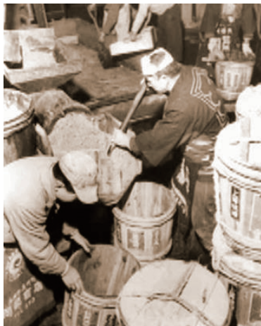
醤油樽の清掃から始まった高圧洗浄機の開発 実家で醤油の醸造を行っていた一人の従業員が、水圧で醤油樽の汚れを落とせないかと考え、試作機を作ったことが、後に会社の売上の柱となる高圧洗浄機開発のスタートだった。

また、農業機械以外にも、社員のアイデアから生まれた醸造樽用高圧洗浄機をはじめ、造船・鉄鋼・石炭・紙パルプといった業界へも、同社のコア技術である「高圧ポンプ」を使った製品は活躍の場を広げていった。