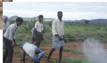
海外での研修の様子

同社は1954(昭和29)年から南米向けに製品を輸出している。以降、アジア・ヨーロッパなど、農業大国と呼ばれる多くの国で有光の製品は使用され、各国でその性能を高く評価されている。