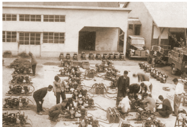
昭和20年代頃の工場での検査風景

1941(昭和16)年からは、特殊潜水艦用ポンプや消防用ポンプといった軍用品の製造にさらなる協力をせざるを得なくなり、有光製作所を有光軍需(株)に改組した。しかし一方で、自社の基幹と位置付けた農用機械だけは絶やさず製造を続けていた。戦況が悪化するにつれ、ガソリンを使う農業用ポンプに対して、役人から「君の会社の製品はガソリンを使うのだろう。ガソリンは軍にとっての重要物だから、農業などで使われては困る」などと批判を浴びることもあったが、『食糧がなかったら戦争には絶対に勝てない。戦争で人手を取られるなか、農業機械は今後ますます必要になっていく』という強い信念をもって製造を継続していった。