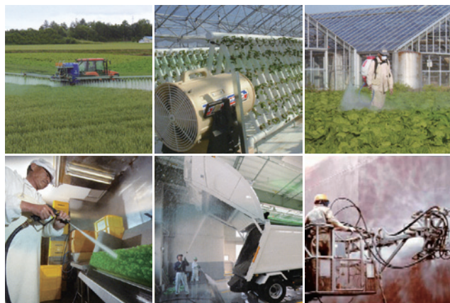
様々な業界に広がる有光工業(株)の技術