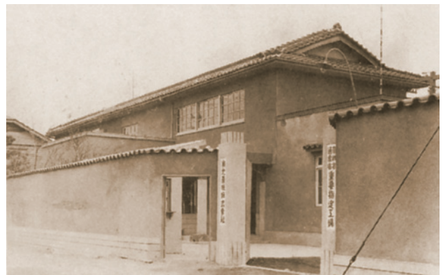
戦前の有光製作所の外観