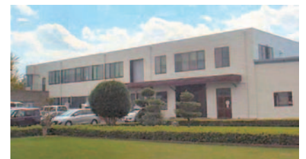
鳥取事業所 浦安工場

当社の現在の主力製品もこの当時から製造を続けています。大阪市内の本社工場で基板の実装から組立まで全てを行い、門真の工場へ納品していました。高度経済成長の波もあり、受注は順調に増え、1967年に鳥取に100%子会社の東陽電気(株)を設立しました。国内事業の拡大は進み1988年までにさらに3つの拠点を作り、ピーク時の従業員数は1,500名でした。現在は鳥取県内に3つの工場を有し生産を行っています。