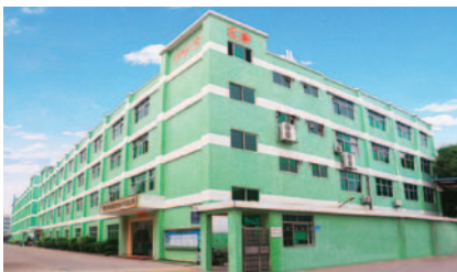
広州工場(上)と上海工場(下)

所を借りることができます。設備は日本から持ち込み、製品を作り、日本に持ち帰るという形でした。中国進出から2年経過し、現地でも事業を展開する手応えをつかみました。そこで、広州番禺旭東阪田電子有限公司という合弁会社を設立し、旭東電気が主導の工場を作り運営を始めました。現在では広州と上海の工場で約3000人が働いています。