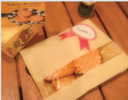
ラッピングキット

「Jolie poche」はフランス語で「すてきな(かわいい)ポケット」という意味。電子メールやネットを通してメッセージを送ることが多い今の時代、直接気持ちを伝えることの大切さや、手書きのぬくもり、あたたかさを思い出してほしい。そんな想いが込められた商品です。現在ではインターネットによる通販や、全国各地の大手雑貨店などで取り扱っています。