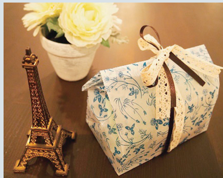
ワックスペーパーバッグ