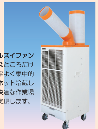
クールスイファン

必要なところだけを効率よく集中的にスポット冷感して、快適な作業環境を実現します。