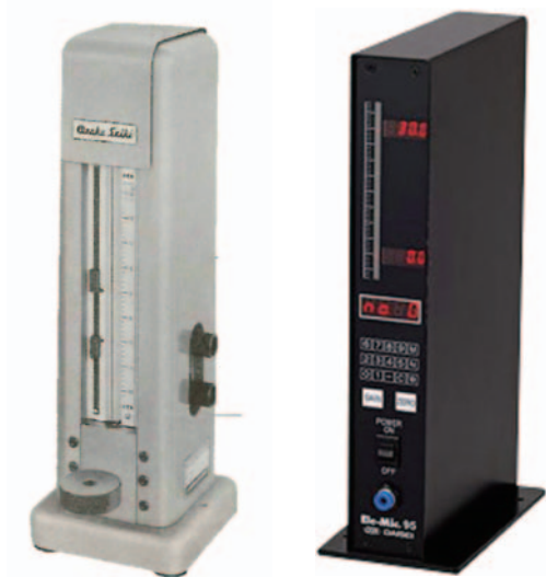
開発当時のエアーマイクロメータ(左)と現行機種(右)

この頃、取引先各社への自動検査機、内外選別機、自動測定機といった主力製品の導入が一巡し、売上が減少傾向にあった。状況打開のために引き受けたアメリカ製研削盤のオーバーホールや改修依頼も、外部の経験者や技術者をスカウトしながら進めるが、なかなか思うような精度が出せず利益に繋がらなかった。従業員への給与の支払いにさえ窮する事態も度々発生するなか、慣れない英文の解説書を深夜までかけて少しずつ解説したり、図面だけを参考に何とか再現を試みるなど、全社をあげた努力によって、どうにか研削盤関連でも利益を出せるようになっていった。