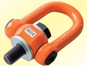
マルチアイボルト

工場によくあるシチュエーションとして、重量物を横吊りにしたり、地面から引き起こしたりといったことがあります。この行為を通常のアイボルトで行うと大変危険で、原則として禁止されています。そこで同社が開発したのが、横吊り専用の「マルチアイボルト」です。重量物吊り上げ軸に対して 360 度回転し、さらに吊り方向に対しても 180 度可動します。従来は大きな危険を伴っての作業でしたが、これを使用することにより安全に作業することが可能になりました。