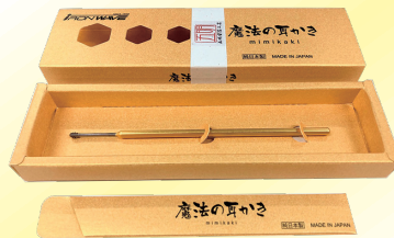
金箔・プラチナ箔を施した高級バージョンも。

ネジのプロがこだわり抜いた先端部分と、耳の奥まで入れられる軸の細さ。一度使うとやみつきになるその心地よさは、普通の耳かきや綿棒では味わうことはできません。また、会話のきっかけにも最適なこの耳かきは、周りの人とのコミュニケーションツールとしても大いに役立ちます。