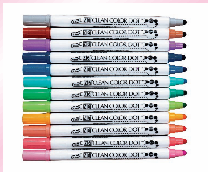
(上) クリーンカラードット 12 色 (左) クリーンカラードットなら、しずく型が簡単に描ける！

呉竹では ZIG クリーンカラードットと同じような性能を持つ「ZIG Memory System Dotta・Riffic (ZIG メモリーシステム ドッタ・リフィック)」という商品を海外向けに 2001 年に発売しています。ペン先の弾力感と、ドットを押すという用途の珍しさから、特にアメリカを中心に人気がありました。そんなドッタ・リフィックをリニューアルして発売されたのが、ZIG クリーンカラードットです。クリーンカラードットに採用した芯先の素材は弾力性に富み、しなりも良く、繊細な細い線や力強い太い線を表現することができるため、本来は主にアイメイク用の化粧品等に使われています。この素材を、先が丸い形状に加工して筆記具として商品化するのは業界初となります。