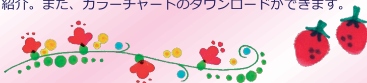
(上) クリーンカラードットで描いたイラスト

芯先を「ぷにっ」と押すと、大きなドットが描け、紙に芯先を軽く当てると、小さなドットが描けます。芯先を押した後、力を抜きながらペンを動かすと、左図のようなしずく型も描けます。同社ホームページでは、クリーンカラードットを使った作品を多数紹介。また、カラーチャートのダウンロードができます。