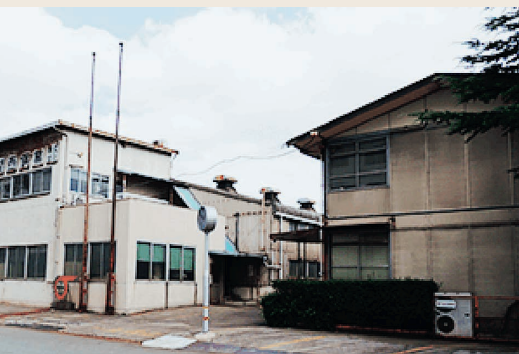
本 社 外 観