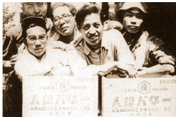
戦後の経営を支えた「人造バター」 手前右の箱にうっすらと「人造バター」の表記と同社のロゴマークが見える

時は折しも、「石炭から石油へ」というエネルギー革命の黎明期にあり、その流れの中で、同社は有機試薬をベースとした合成技術、精製蒸留技術を活かして、徐々に工業薬品分野へシフトしていった。