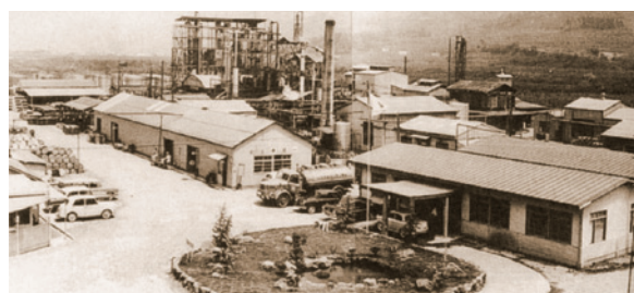
事業拡大にともない建設された柏原工場（現大阪事業所）