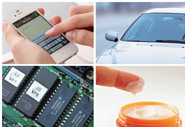
様々な産業分野で使用されている同社の製品

創業者の心は、その分身たる会社を器として従業員一人ひとりの心に溶け込み、続く未来へと受け継がれていく。