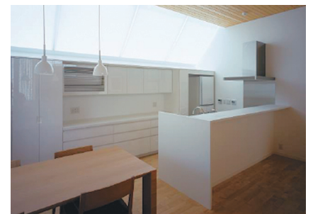
同社が手掛けるマンション家具

しかし、2008年のリーマンショックにより、状況が一転します。色々なゼネコンに新規営業をかけていきましたが仕事をいただける状況ではなくなりました。また、このタイミングで現場のベテラン社員が多数辞め、ベテランに頼っていた難しい仕事もできなくなり、仕事を縮小せざるを得なくなりました。ここまで悪いことが重なると、いっそのこと仕事を取捨選択する時期になったんだと思い、店舗や施設の物件の仕事辞め、マンション家具の仕事一本にすることにしました。