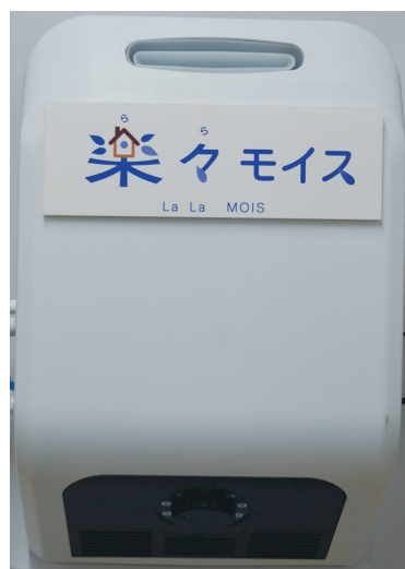
水道直結型の加湿器「楽々モイス」

じっとしているわけにはいきません。将来を見据えて色々な製品を開発していかないといけません。何でもアイデアが良いと思ったらすぐに開発に着手してきました。会社の「エコロジカル、快適、健康」これに関する商品であれば何を作っても良いのです。