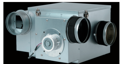
同社が手掛ける熱交換装置「澄家DC」換気システム

飛躍のきっかけになったのは、2003年の建築法改正です。改正に伴い、住宅の換気が義務化になりました。それまで換気の必要な場所は、お風呂場、お手洗い、洗面所、キッチンのみでしたが、改正によりすべての部屋で換気が必要になりました。これは大きなビジネスになると確信し、住宅業界に飛び込みました。