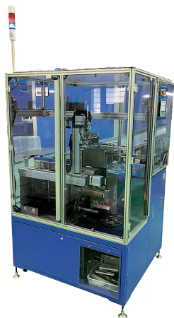
ラベル自動貼付け装置

主力製品：電子部品・機器、フィルム加工の開発・試作・製造、 自動化・省力化機器・FAロボットの開発設計・製造 医療機器・ヘルスケア関連機器の開発設計・製造など