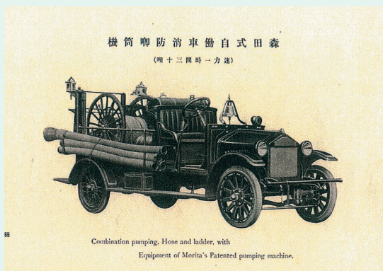
同社第1号の国産消防ポンプ自動車

さらに1917年、当時わが国自動車産業が未発達であったため、車体（シャシ）を外国から輸入し、それに消防ポンプを架装した国産消防ポンプ自動車を完成させました。これが現在の消防自動車の出発点となるものです。