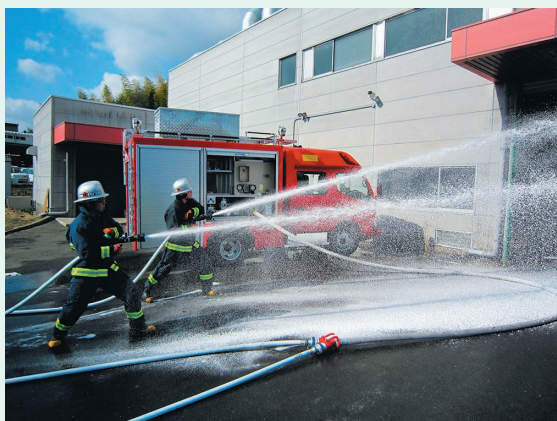
Miracle CAFS Car(ミラクルキャフスカー)

また、泡の消火原理は空気の供給を断つ窒息消火で、全体を覆う必要があるため、これまでは木造火災に適さないとされていました。しかし、実験の結果、CAFSの消火原理で十分に効果があることが確認されました。コンプレッサーで泡を発生させるCAFSと、新消火薬剤「ミラクルフォーム」により生まれた「Miracle CAFS Car (ミラクルキャフスカー)」は、消火原理の確認と実験を何度も繰り返すことで、より確かな性能を実現しました。