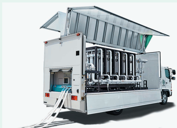
Miracle N7(ミラクルエヌセブン)

短時間では人体にほとんど影響がなく、火がつかない酸素濃度(12.5%)に維持することができるため、人命救助と消火・防火の両立が可能です。水損被害が危惧される洞道やデータセンター、重要文化財などへの配備も期待されています。