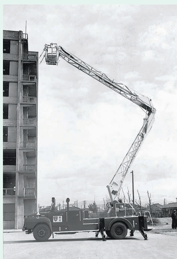
16m スノーケル車 (屈折はしご付 消防自動車)

1962年になると、タイに285台の消防車を輸出したのを皮切りに、3年後の1965年にはA.P.A.(アメリカ陸軍調達局)に化学消防車114台を輸出。そして1974年には、アメリカ・シカゴ市消防局に東洋一を誇る40mのはしご付消防車を納入し、世界水準の技術力と生産力をもつ企業であることを実証しました。これを機にモリタの名は広く国内外で注目されるようになっていきました。